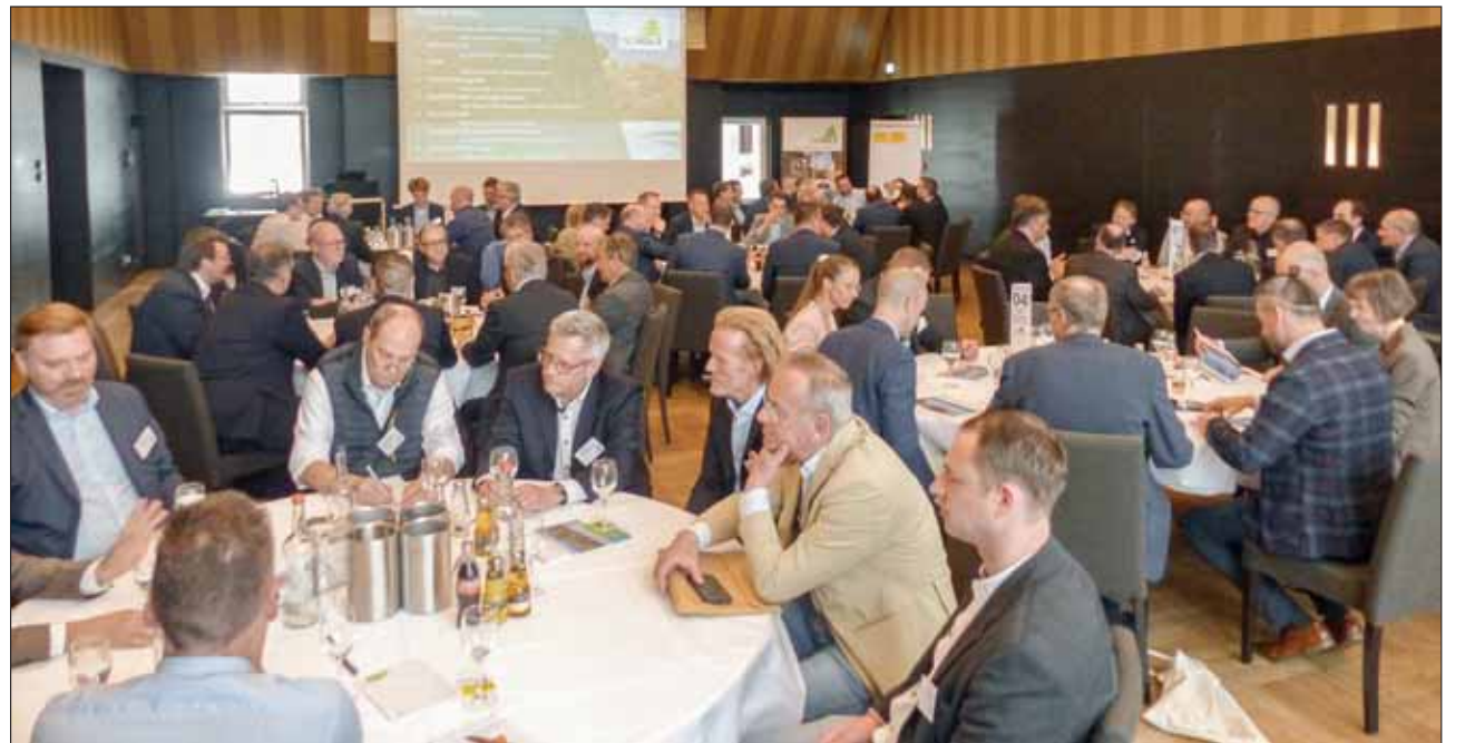
An acht runden Tischen diskutierte jeweils ein Fachmann mit interessierten Holzhändlern über ein zuvor festgelegtes Thema der Branche. Jeder Händler hatte die Möglichkeit, nacheinander an drei Diskussionen teilzunehmen.

Holzexport bedeutet. Ghana ist nach Indonesien das zweite Land weltweit, dass eine solche Zertifizierung gemeinsam mit der EU Union entwickelt und eingeführt hat. Dieser Prozess begann in dem afrikanischen Land 2008 und betrifft die gesamte Lieferkette vom Wald über die Holzbearbeitung bis zum Export. Die Zertifizierung erfasst nahezu alles Holz, was in Ghana gehandelt wird. Nicht erfasst werden bestimmte Produkte, die zum Verbrennen vor Ort bestimmt sind.